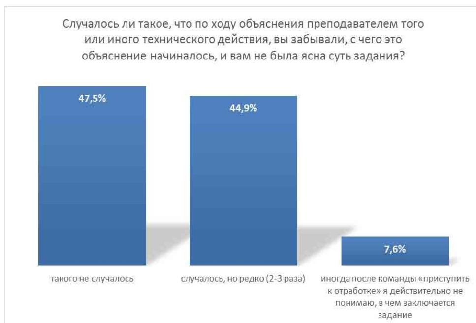
Рисунок 2 — Оценка обучающимися доступности к восприятию рассказа и показа преподавателями учебного материала