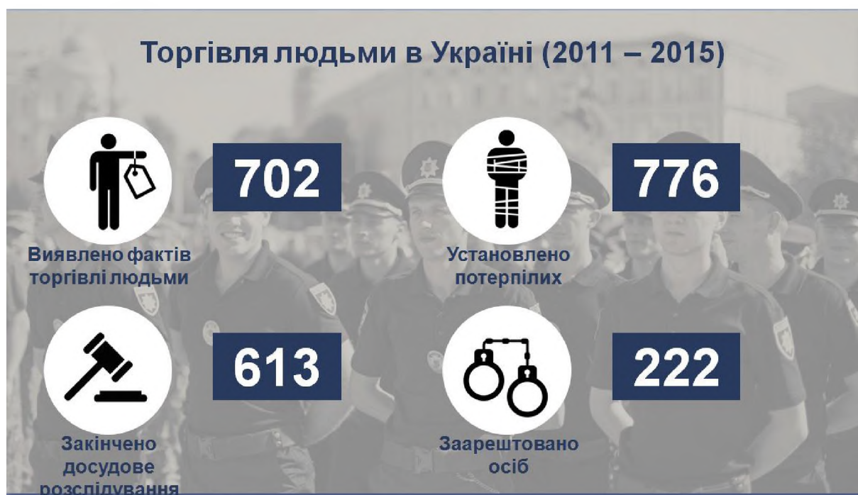
Рисунок 1 – Торговля людьми в Украине (2011–2015 гг.)

Несколько иные данные о количестве пострадавших от торговли людьми в Украине приводит Представительство Международной организации по миграции в Украине.