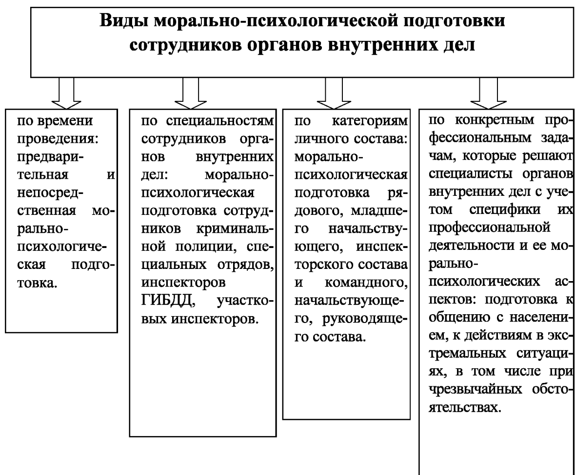
Рисунок 2 – Виды морально-психологической подготовки сотрудников органов внутренних дел

осуществляется посредством морально-психологической подготовки как составляющей профессиональной подготовки специалистов – сотрудников органов внутренних дел в период их обучения в ведомственной образовательной организации. При этом морально-психологическая подготовка охватывает и обучение, и воспитание, и личностное развитие обучающихся. Исходя из единства целей, задач и содержания морально-психологической подготовки, можно утверждать, что это - комплексный вид подготовки, сочетающийся со специфическим практико-ориентированным обучением курсантов как будущих специалистов – сотрудников органов внутренних дел. Имея общую основу для всего личного состава органов внутренних дел, морально-психологическая подготовка ориентируется и дифференцируется применительно к решению частных задач образования сотрудников, определяя различные виды такой подготовки. Виды морально-психологической подготовки мы представили на рисунке 2.