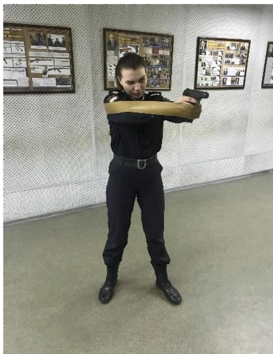
Рисунок 2 — Вариант упражнения с лентой за спиной

При построении упражнений с лентой предлагается два возможных варианта. В первом случае лента закрепляется вдоль линии рук и далее на рукоятке пистолета так, чтобы она не мешала правильному удержанию оружия. Обучающийся осуществляет вынос оружия, фиксацию пистолета и удержание его в таком положении (рисунок 2).