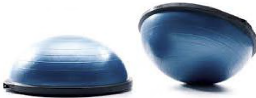
Рисунок 1 — Балансировочная платформа BOSU

Для тренировки данного навыка целесообразно использовать в ходе проведения занятий специальные балансировочные платформы. Наиболее оптимальным представляется использование платформы BOSU, поскольку она позволяет использовать в процессе тренировки как мягкую резиновую полусферу, так и жесткую пластиковую платформу (рисунок 1).