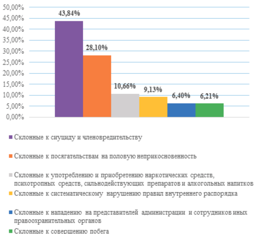
Рисунок 2 — Количество осужденных, состоящих на профилактическом учете

Особую тревогу вызывают количественные показатели совершения нападения на персонал исправительных учреждений. По данным Федеральной службы исполнения наказаний, количество действий, дезорганизующих деятельность учреждений, обеспечивающих изоляцию от общества, в последнее время неуклонно увеличивается (таблица 1). При этом отметим, что в статистической отчетности отражаются только преступления, предусмотренные ч. 3 ст. 321 Уголовного кодекса Российской Федерации.