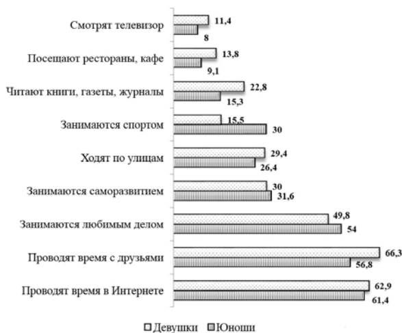
Рисунок 1 — Распределение ответов юношей и девушек на вопрос «Как Вы обычно проводите свое свободное время?», в процентах

Примечание. При ответе можно было отметить несколько вариантов (не более трех), поэтому сумма может составлять более 100 %.